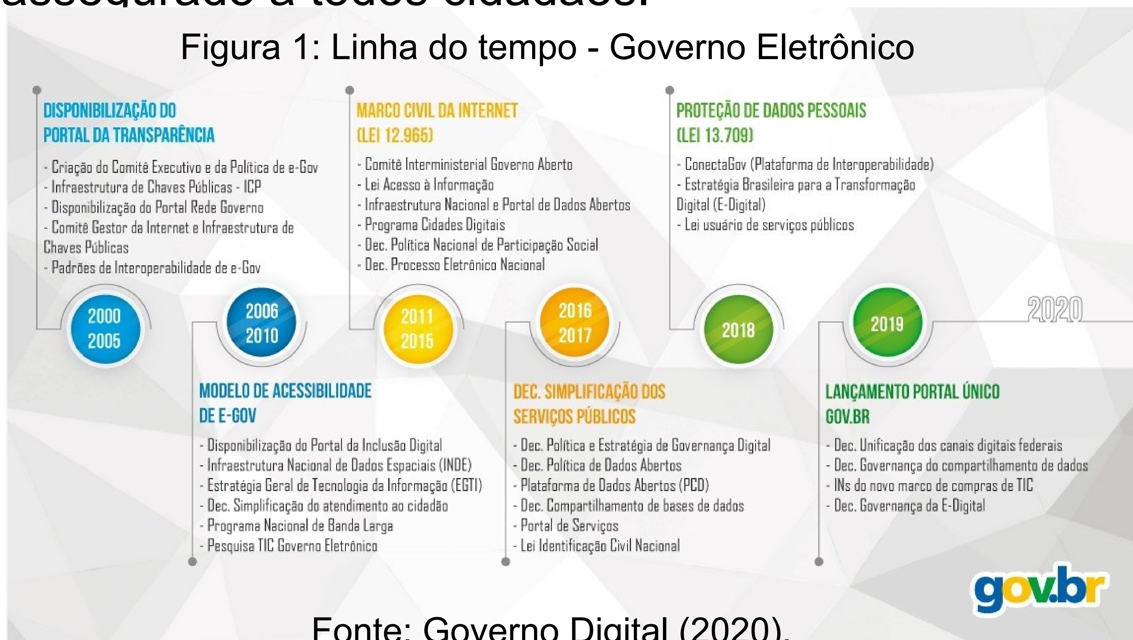
Figura 1: Linha do tempo - Governo Eletrônico

Conteúdos em meio digital têm o potencial de democratizar o acesso às informações, direito assegurado a todos cidadãos.